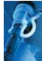
Die Option Außeneinspritzung ermöglicht den Einsatz bestimmter korrosiver Konzentrate.

Die Optionen ermöglichen es, den Dosatron optimal an den Bedarf anzupassen. Deren Notwendigkeit wird mit der Unterstützung unserer technischen Abteilung festgelegt.